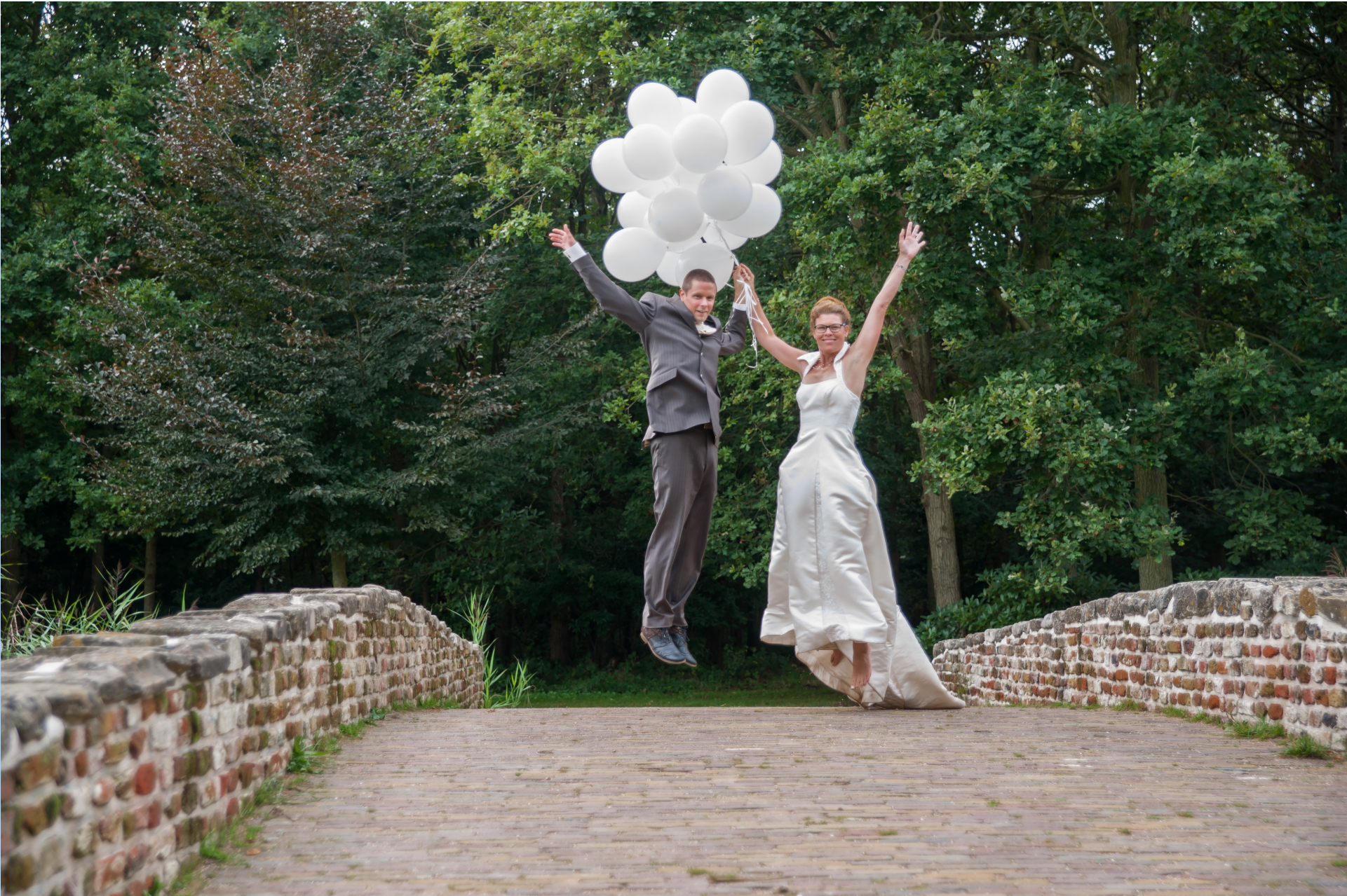
Het Mary Poppins effect